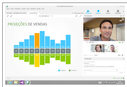
Figura 1. Compartilhamento de conteúdo durante uma reunião

Compartilhe conteúdo ou toda a sua tela com participantes remotos em tempo real. Passe o controle para outros participantes para que eles possam compartilhar conteúdo ou fazer anotações. A figura 1 é um exemplo de conteúdo que está sendo compartilhado com o falante ativo e outros participantes da reunião.