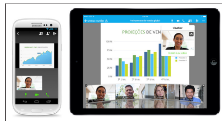
Figura 3. Converse usando qualquer dispositivo

Aproveite uma vasta experiência de reunião com áudio, vídeo e compartilhamento de conteúdo através de dispositivos Android, iPhone e iPad, Blackberry 10 e Windows Phone 8.